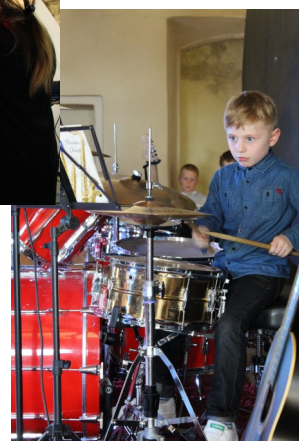
Nos jeunes artistes en action